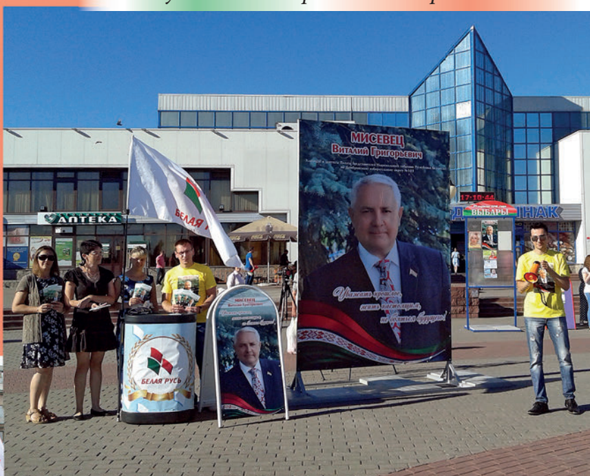
Пикет в поддержку кандидата в депутаты Парламента Мисевца В. Г. 2016 г.