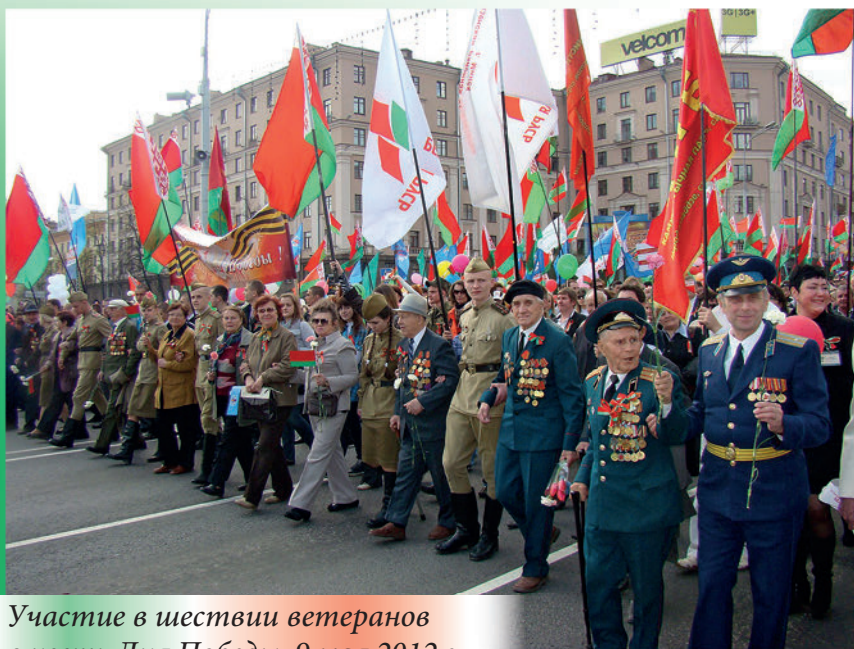
Участие в шествии ветеранов в честь Дня Победы. 9 мая 2012 г.