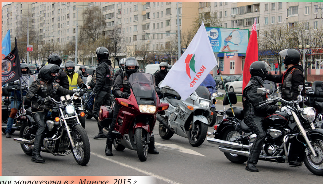
Во время открытия мотосезона в г. Минске. 2015 г.