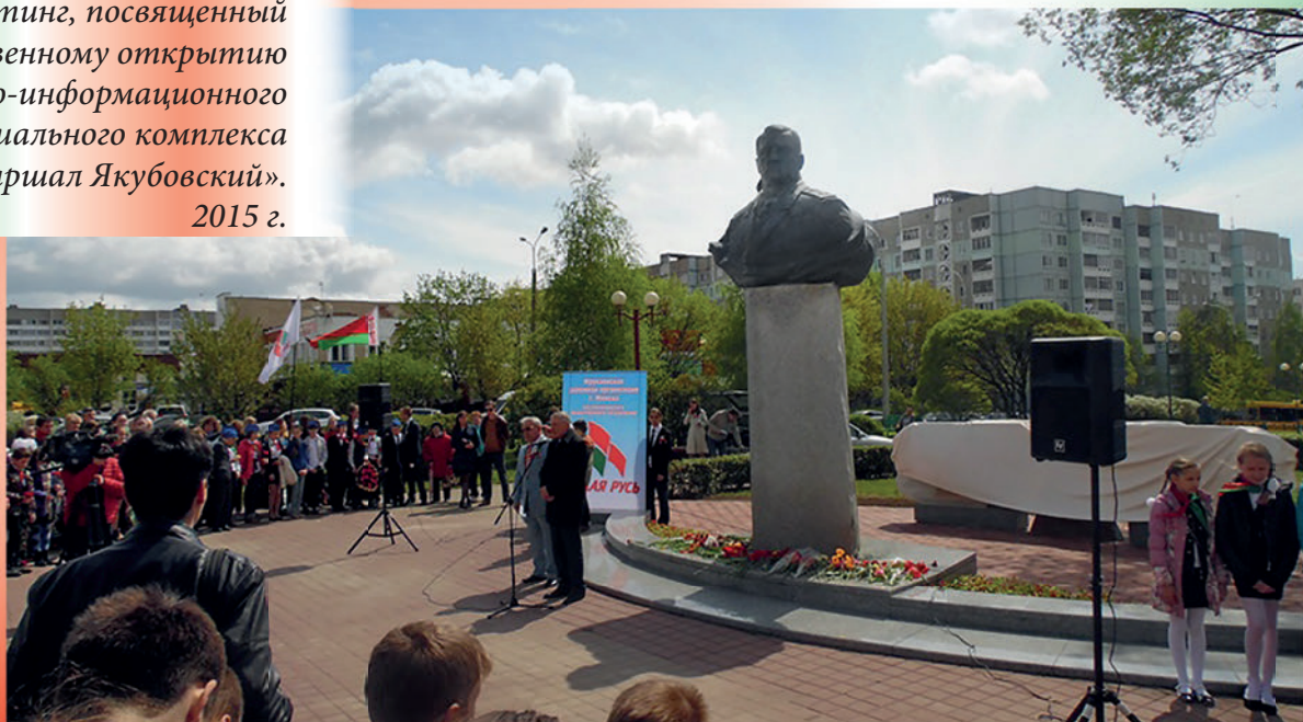
Митинг, посвященный торжественному открытию историко-информационного мемориального комплекса «Маршал Якубовский». 2015 г.