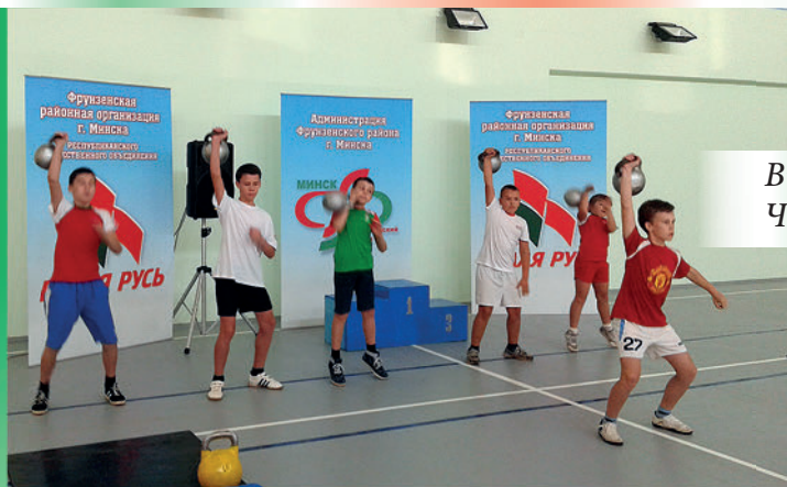
Выступление юных гиревиков на открытии Чемпионата Европы по гиревому марафону. 2014 г.