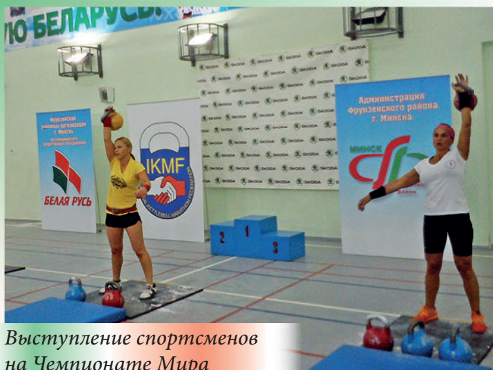
Выступление спортсменов на Чемпионате Мира по гиревому марафону. 2015 г.

Среди учащихся, активистов проводятся турниры по спортивной сауне и соревнования по пулевой стрельбе на призы районной организации.