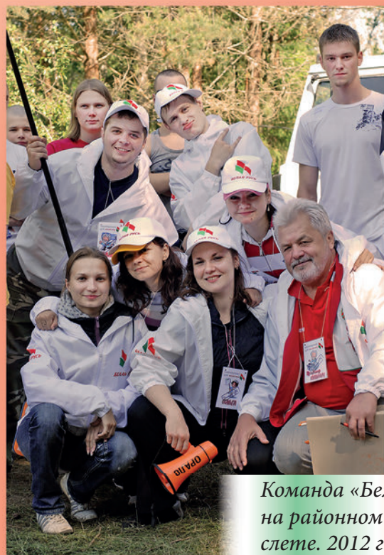
Команда «Белая Русь» на районном туристическом слете. 2012 г.

Одна из составляющих успеха общественного актива района — активная жизненная позиция, инициативность, готовность действовать на сплочение, совместный труд, досуг, общественную работу, проявляя умения, навыки, таланты и творчество.