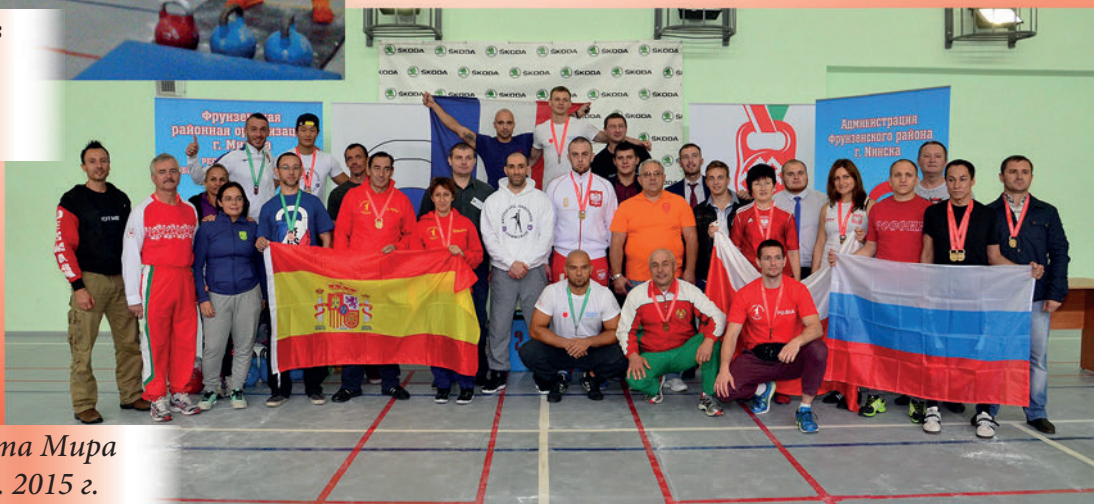
Участники Чемпионата Мира по гиревому марафону. 2015 г.