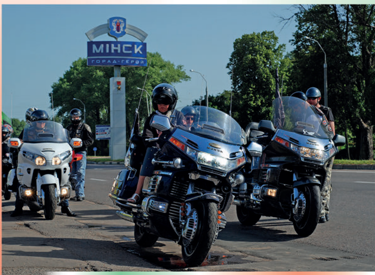
Движение колонны во время автомотоагитпробега, посвященного Дню Независимости Республики Беларусь по маршруту Фрунзенский район г. Минска – г. Смолевичи. 3 июня 2009 года.

Проект по увековечению памяти дважды Героя Советского Союза, Маршала Советского Союза Ивана Якубовского осуществляется «Белой Русью», ветеранами Великой Отечественной войны, ветеранами Вооруженных Сил, ветеранами труда. Создан историко-информационный мемориальный комплекс «Маршал Якубовский» (автор идеи — Г. Равич, архитектор — Н. Михайлов, скульптор — В. Дубовик). «Белая Русь» и администрация района проводили подготовительную работу: собирая средства, привлекли более 30 организаций района. 8 мая 2015 г. памятник танкистам Якубовского был установлен.