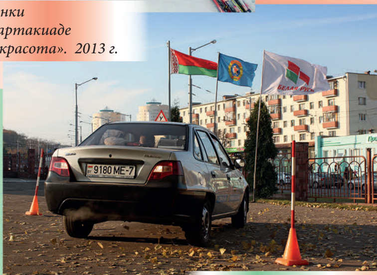
Соревнования по автомногоборью. 2013 г.