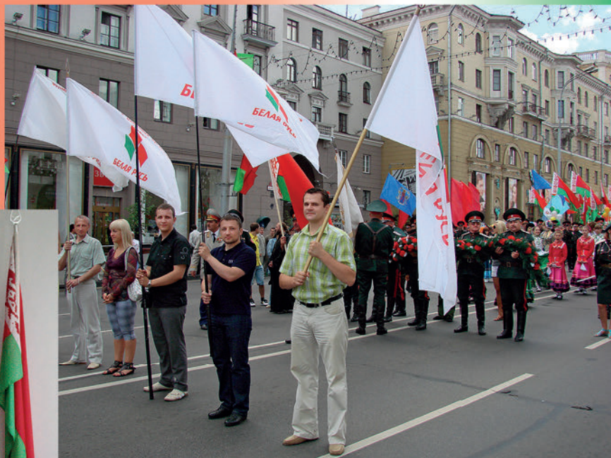
Участие в шествии в честь Дня Независимости Республики Беларусь. 2010 г.