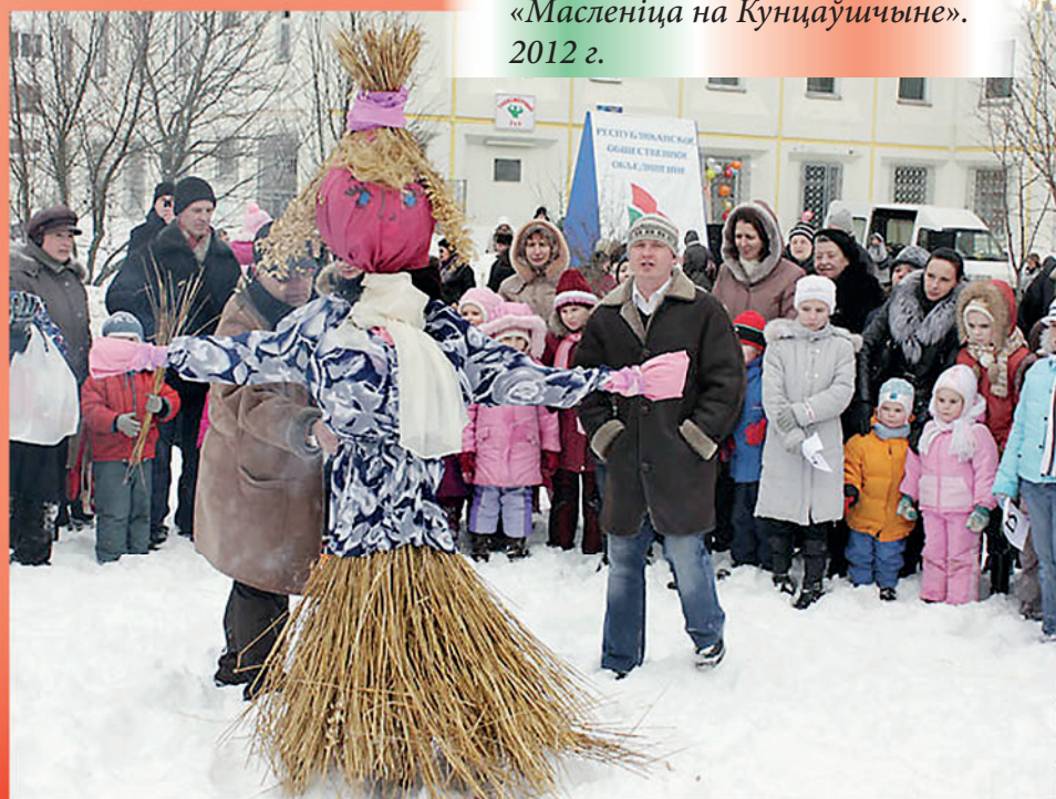
«Масленіца на Кунцаўшчыне». 2012 г.