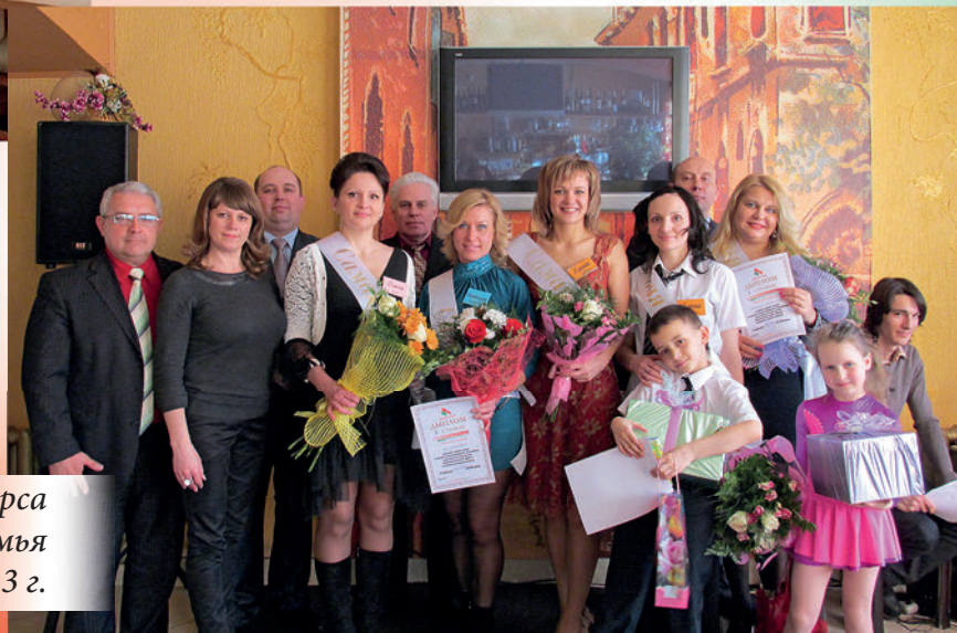
Участники и организаторы конкурса «Лучшая многодетная семья Фрунзенского района г. Минска». 2013 г.