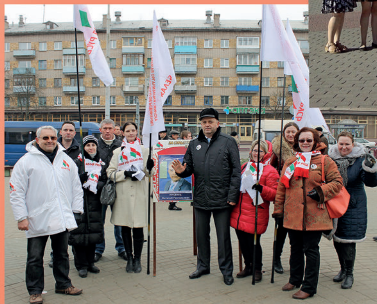
Пикет в поддержку кандидатов в депутаты Мингорсовета членов Фрунзенской районной организации РОО «Белая Русь». 2014 г.