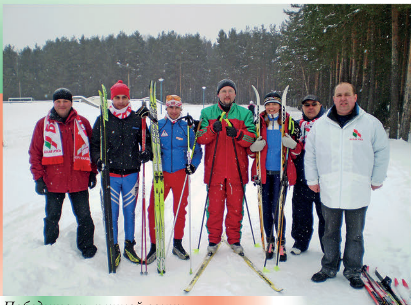
Победители лыжной гонки на зимней районной спартакиаде «Молодость, здоровье, красота». 2013 г.