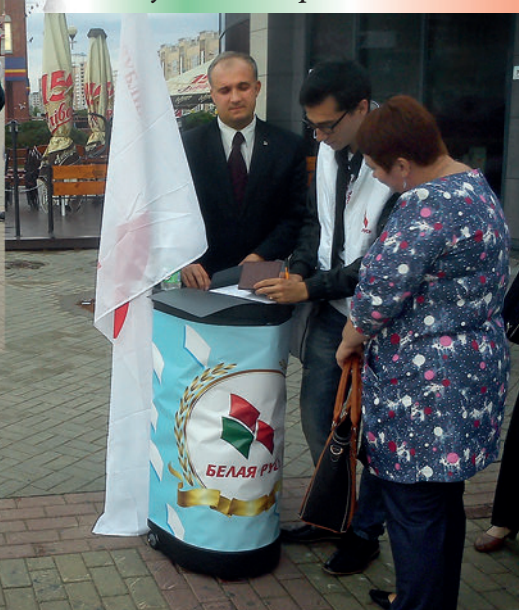
Пикет по сбору подписей по выдвижению кандидатом в Президенты Республики Беларусь Лукашенко А. Г. 2015 г.