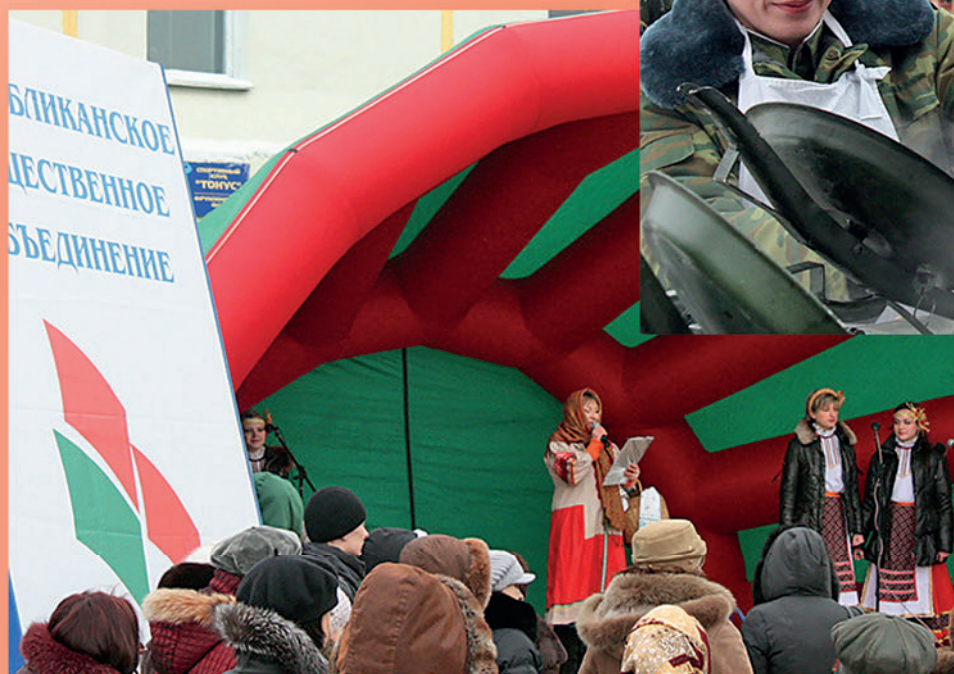
«Каляды на Кунцаўшчыне». 2010 г.

Фольклорные праздники «Каляды на Кунцаўшчыне» и «Масленіца», традиционно проводимые самоуправлением микрорайона, поддержаны районной «Белой Русью» и обрели новое звучание. С участием всех заинтересованных: КОТОСа, ЖЭУ, п/о школ микрорайона, центра дополнительного образования «Эврика» тщательно готовится развлекательная программа: обрядовые песни, театрализованные представления, выездная торговля, зимние игры и забавы, солдатская каша и блины, спортивные состязания и многое другое.