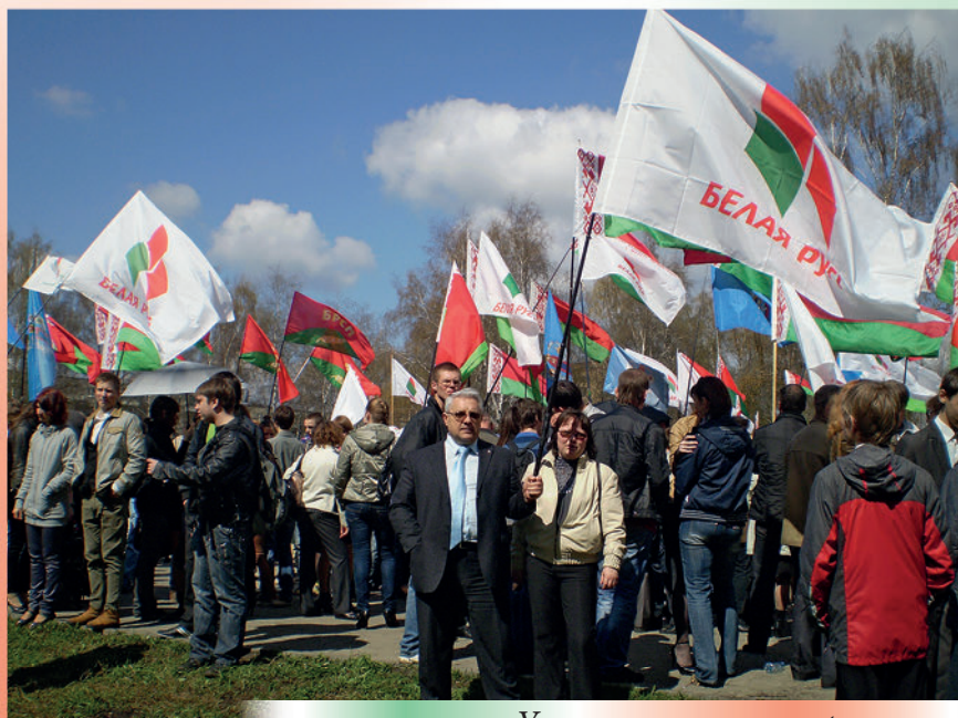
Участие в митинге-реквиеме по трагедии на Чернобыльской АЭС. 2015 г.

Акция «Белая Русь — инвалидам!» проводится совместно с управлением социальной защиты и сопровождается бесплатной доставкой плодоовощной продукции.