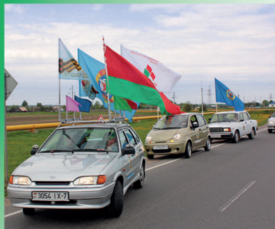
Движение колонны во время автомотоагитпробега «Факел победы – 65» по маршруту Фрунзенский район г. Минска – г. Солигорск. 9 мая 2010 г.

Своеобразная визитная карточка района — ежегодные автомотоагитпробеги «Факел Победы» по маршруту Фрунзенский район — места боевой славы Минщины, которые приурочиваются к государственным праздникам. Проходят они по городам и мемориальным комплексам (Молодечно, Радошковичи, Мядель, Любань, Узда, Смолевичи, Солигорск, Хатынь, Курган Славы, «Линия Сталина»). Торжественно возлагаются венки и цветы к памятникам погибшим воинам, чествуют активистов, поют молодые исполнители, соревнуются спортсмены (волейбол, дартс, гиревой спорт, корфбол), выступают автомобилисты ДОСААФ, ракетомоделисты Центра технического творчества района, мотоциклисты клуба «Жизнь в движении». Остаются в памяти