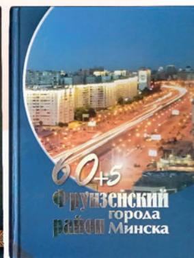
Книги о Фрунзенском районе г. Минска