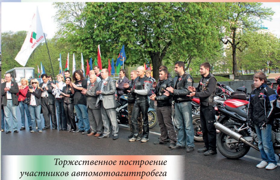
Торжественное построение участников автомотоагитпробега «Факел победы – 65». 2010 г.