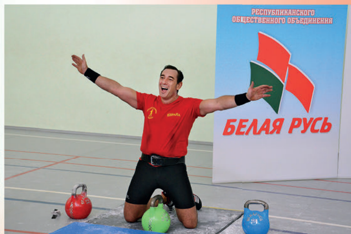
Испанский спортсмен на Чемпионате Мира по гиревому марафону. 2015 г.