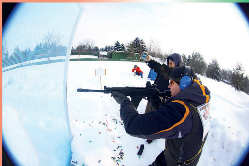
Соревнования по практической стрельбе посвященные Дню защитника Отечества.