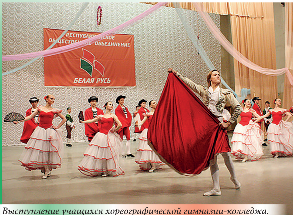
Выступление учащихся хореографической гимназии-колледжа. «Белая Русь»: дети — детям!». 2010 г.