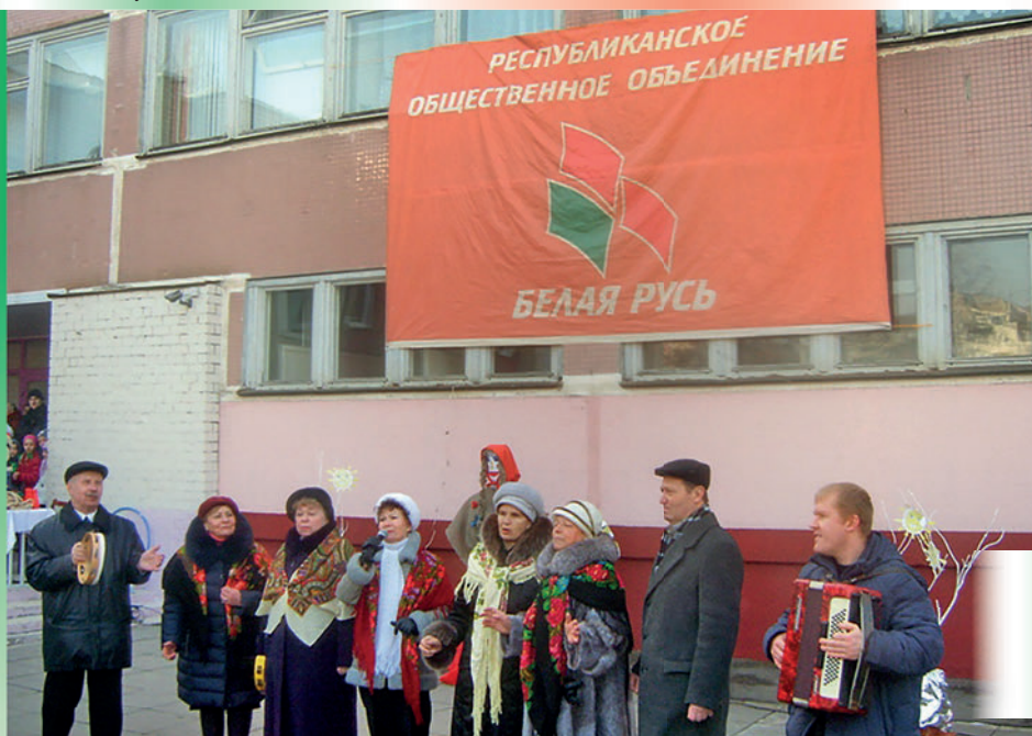
Хор ветеранов КОТОС № 101 выступает на празднике «Масленица на Кунцаўшчыне». 2015 г.