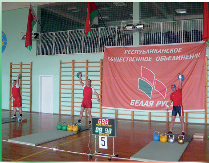
Выступление спортсменов на I Открытом Кубке по гиревому марафону на призы Фрунзенской районной организации г. Минска РОО «Белая Русь». 2011 г.