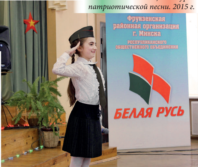
Участница конкурса патриотической песни. 2015 г.

Как эффективный результат акции «Белая Русь — за безопасность дорожного движения!» — первоклассники ежегодно получают фликеры. «Белая Русь» и ГАИ района школьникам передали 4 тысячи световозвращательных элементов. На базе одной из школ района при поддержке ДОСААФ от-