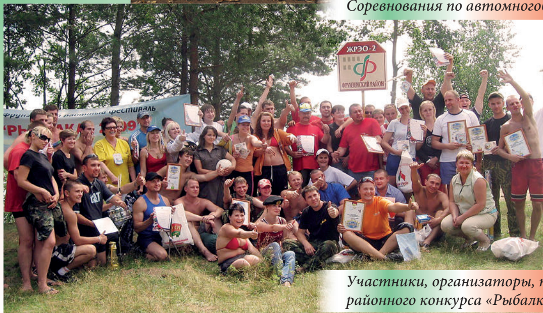
Участники, организаторы, победители районного конкурса «Рыбалка». 2009 г.

Фрунзенская районная организация г. Минска РОО «Белая Русь»